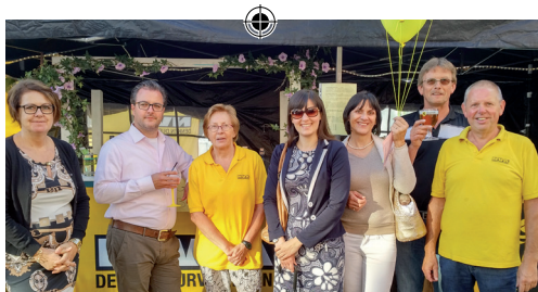
Schoon volk op Avondfeest p.2